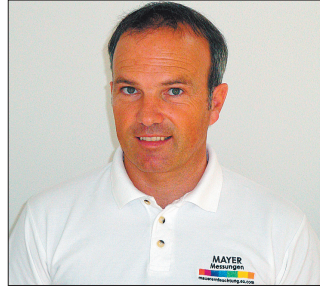
Experte für Mauertrockenlegung & Messungen seit über 15 Jahren.

Jahrelange Erfahrungen und beste Erfolge, u. a. bei öffentlichen Einrichtungen.